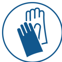
ODZIEŻ OCHRONNA RĘKAWICE CHRONNE

Najwyższe dopuszczalne stężenia w miejscu pracy